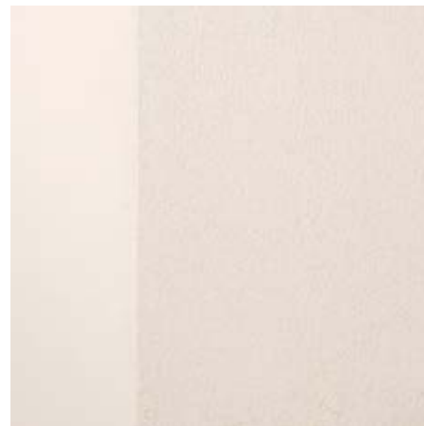
WÄNDE 3 Kalkputz